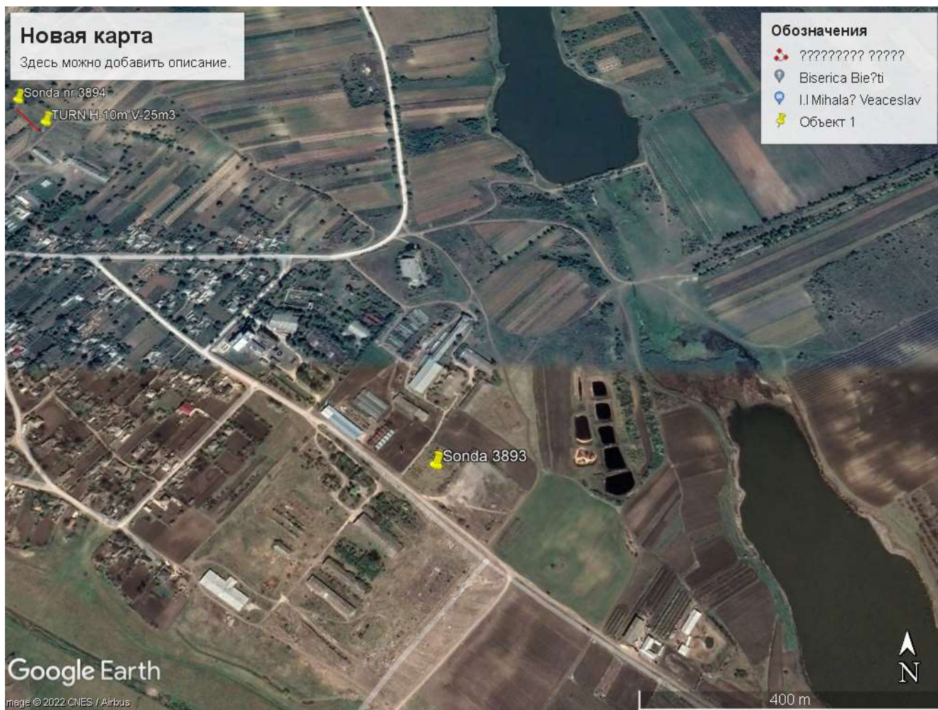
Fig. 1 Plan general localitate cu indicarea amplasării sondei