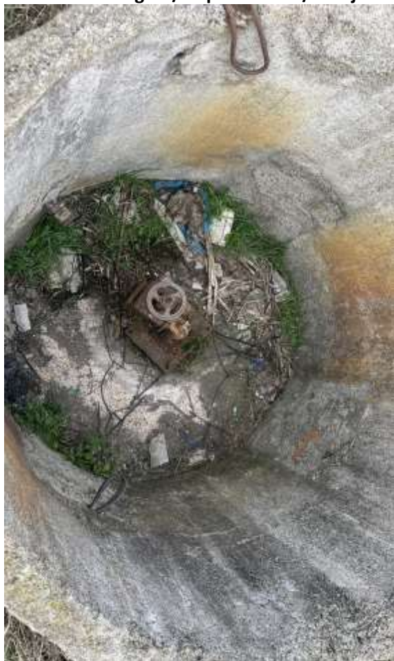
Camera tehnologică / Cap de sondă / Utilaj