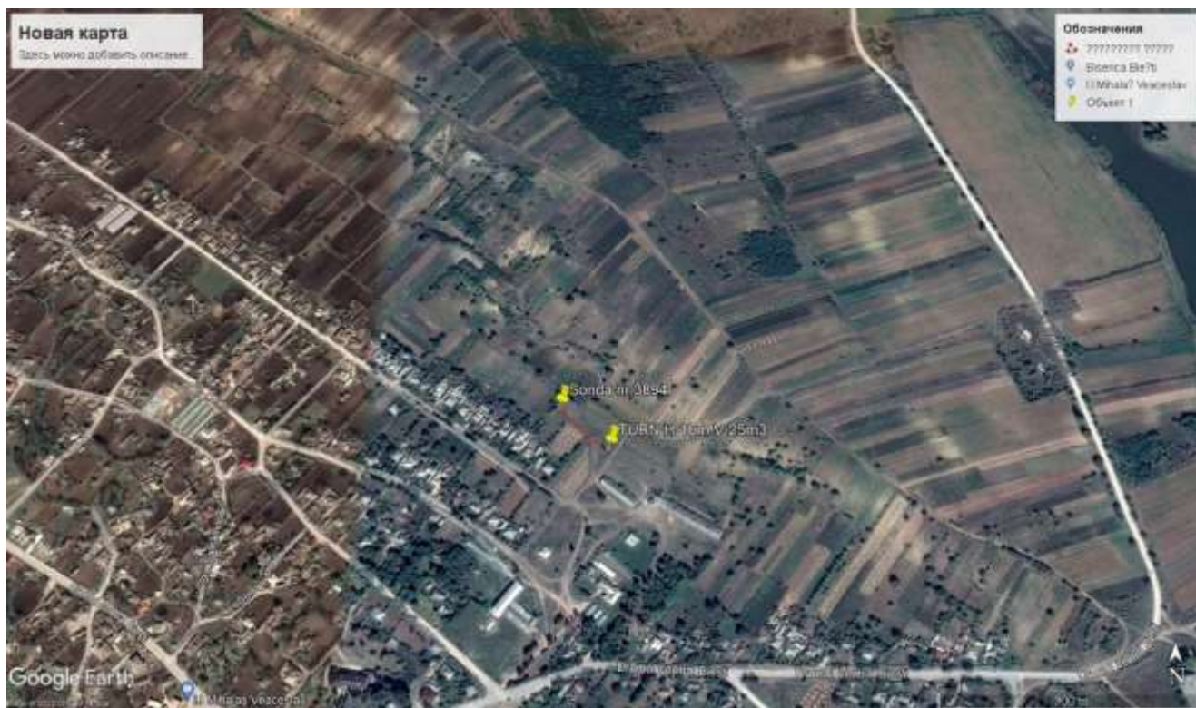
Fig. 1 Plan general localitate cu indicarea amplasării sondei și Castelului de apă